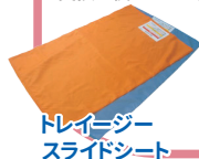
トレージャー スライドシート

体の下に敷き込み、体を滑らせることで、移乗・体位変換時の力を軽減します。主にベッド上での位置修正や体位変換に使用します。