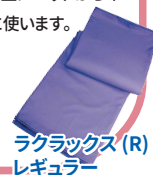
ラクラックス (R) レギュラー